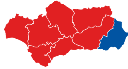
Escaños (Mayoría absoluta: 55)